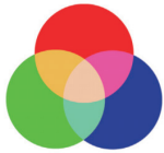
Darstellbares Farbspektrum / Displayable colour spectrum

Mischfarben werden mit der Ansteuerung mehrerer Eingänge gleichzeitig erreicht. / Mixed colours will be achieved with the control of multiple inputs simultaneously.